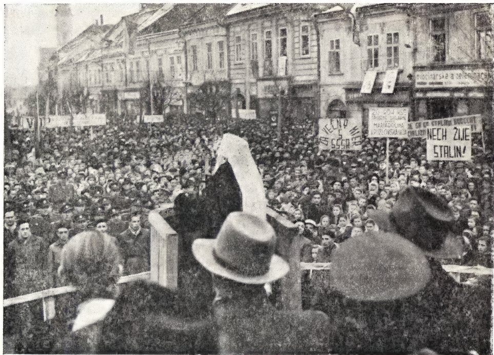
Митрополит Николай в г. Прáшеве произносит речь на митинге в защиту мира

всеми присутствующими соответствующая резолюция для передачи ее Национальному Собранию.